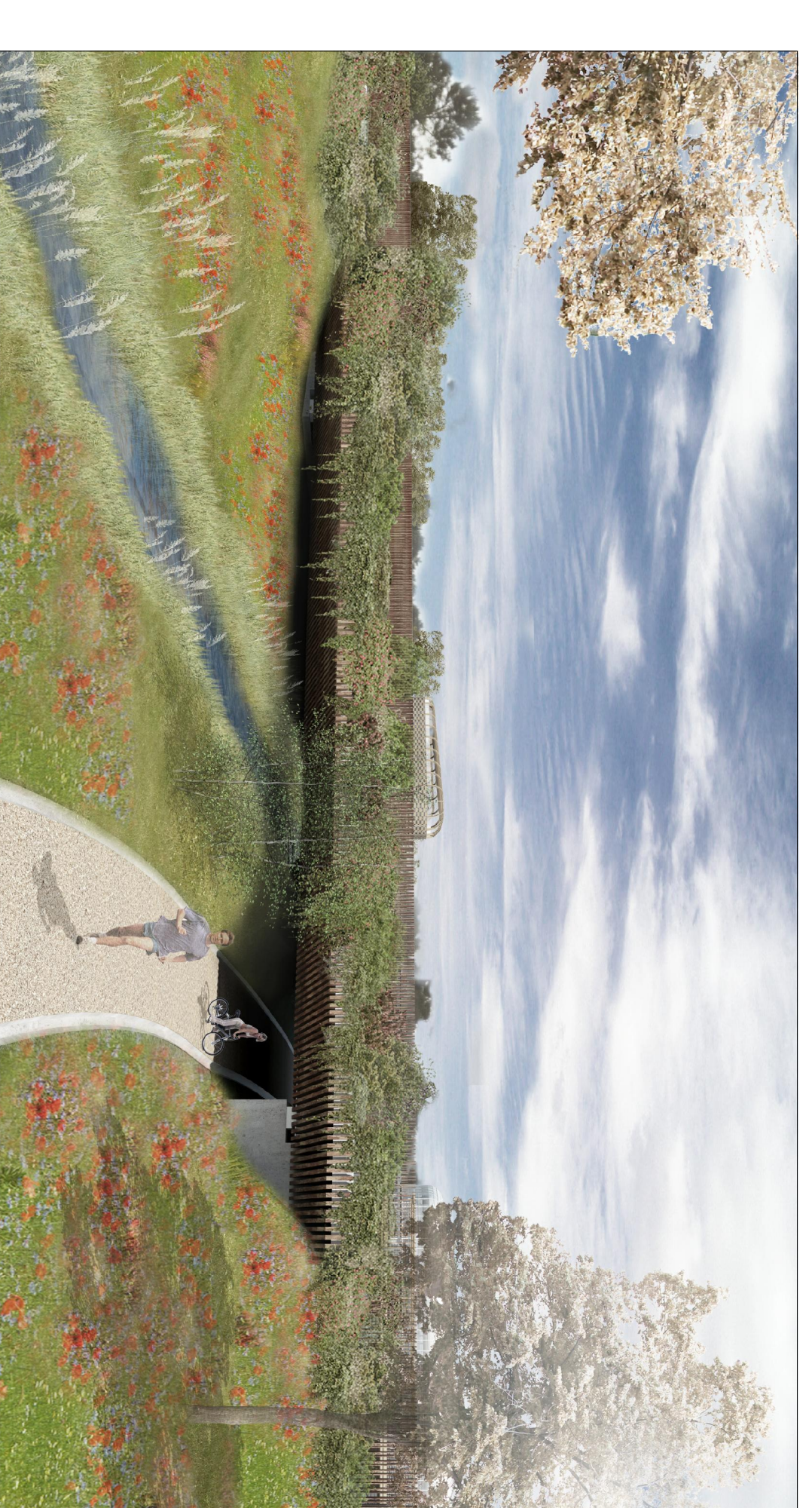
IMMAGINE GRAFICA DEL PONTE CARRABILE