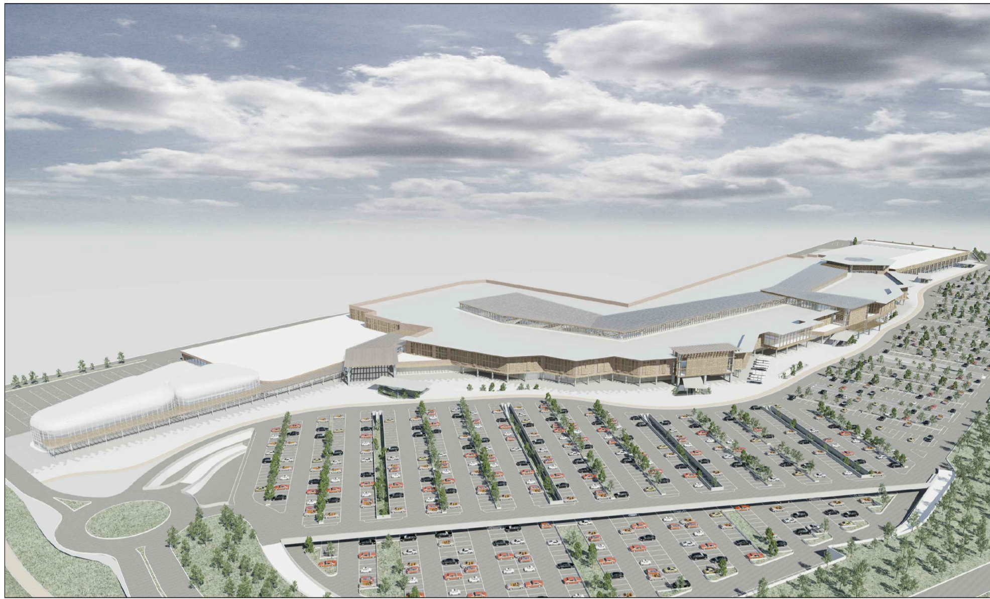
vista dei parcheggi da Ovest