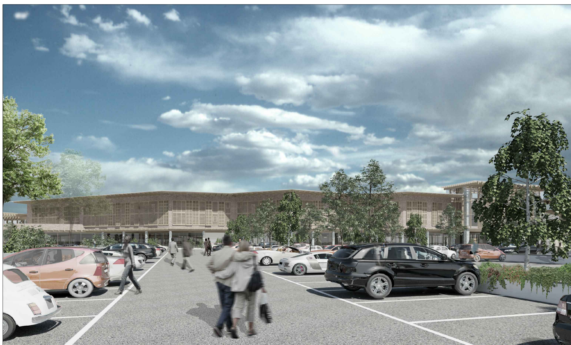
vista verso gli ingressi del centro polifunzionale