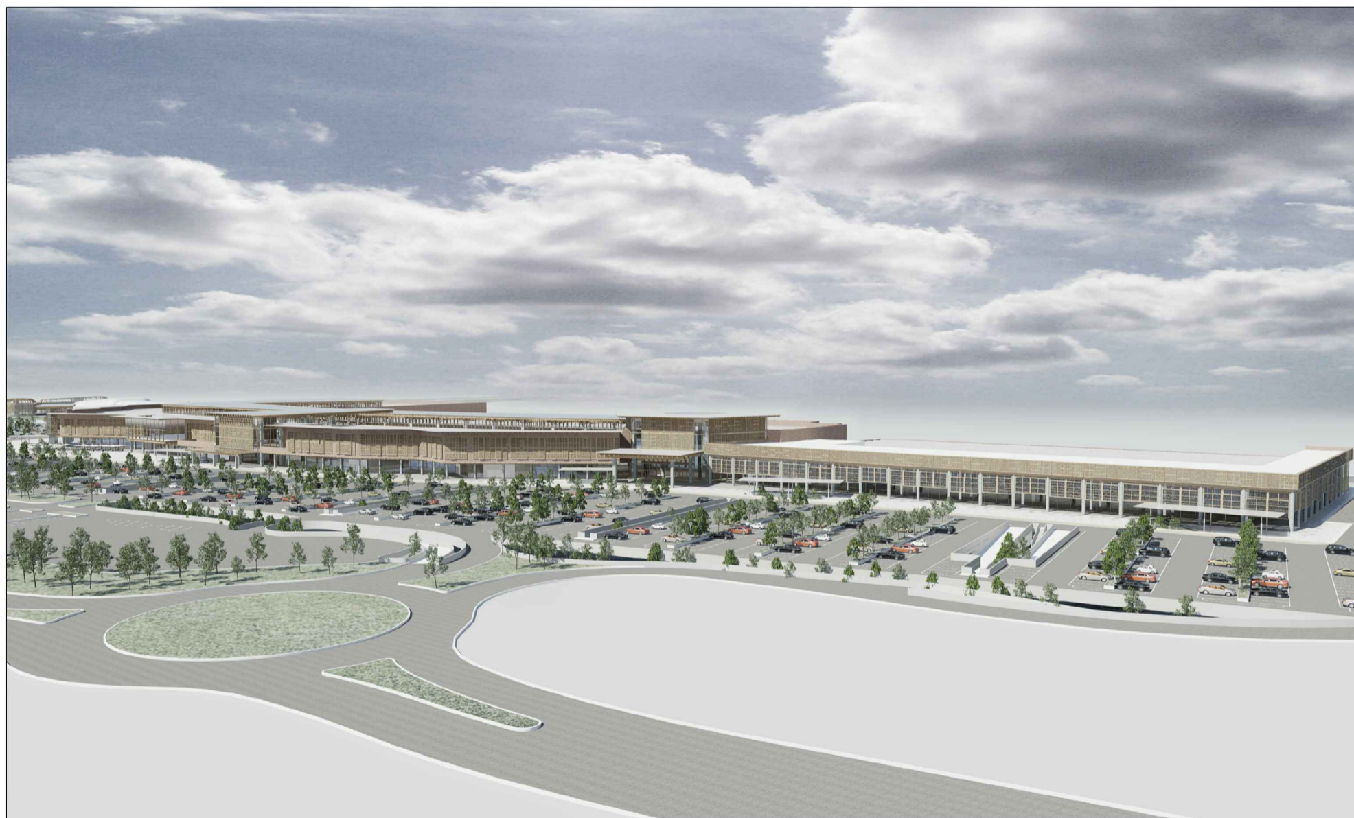
vista dei parcheggi da Est