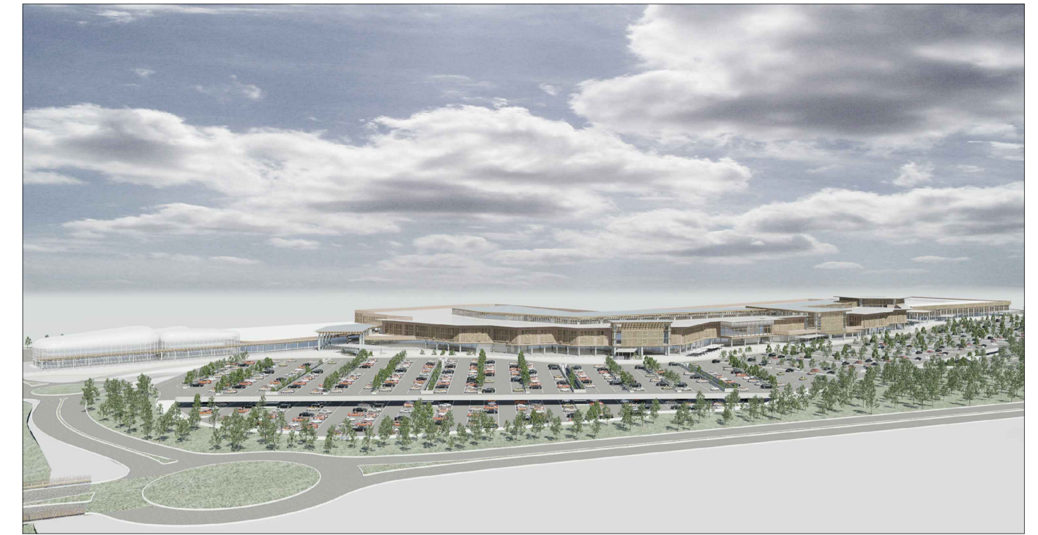
vista dei parcheggi dal lato Lura