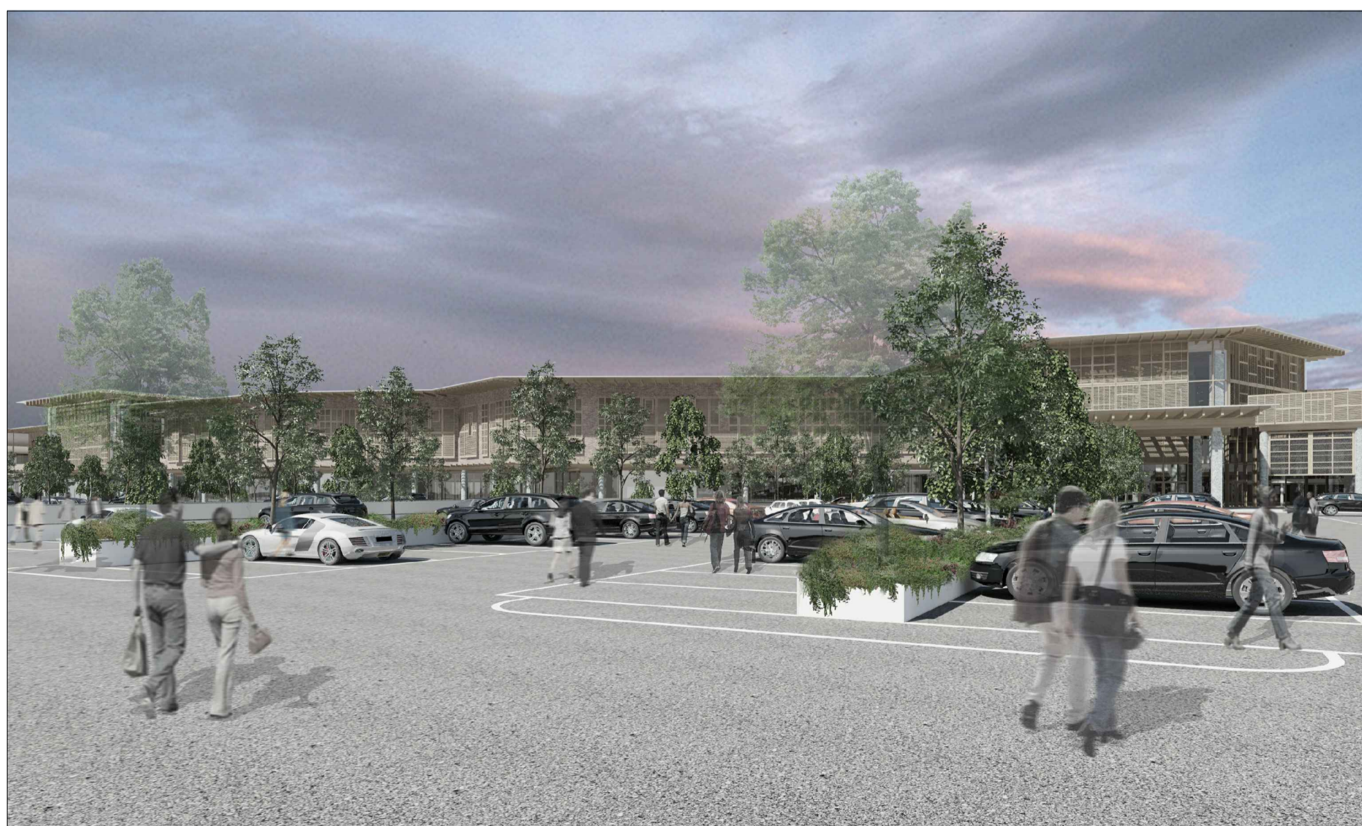
vista verso gli ingressi del centro polifunzionale