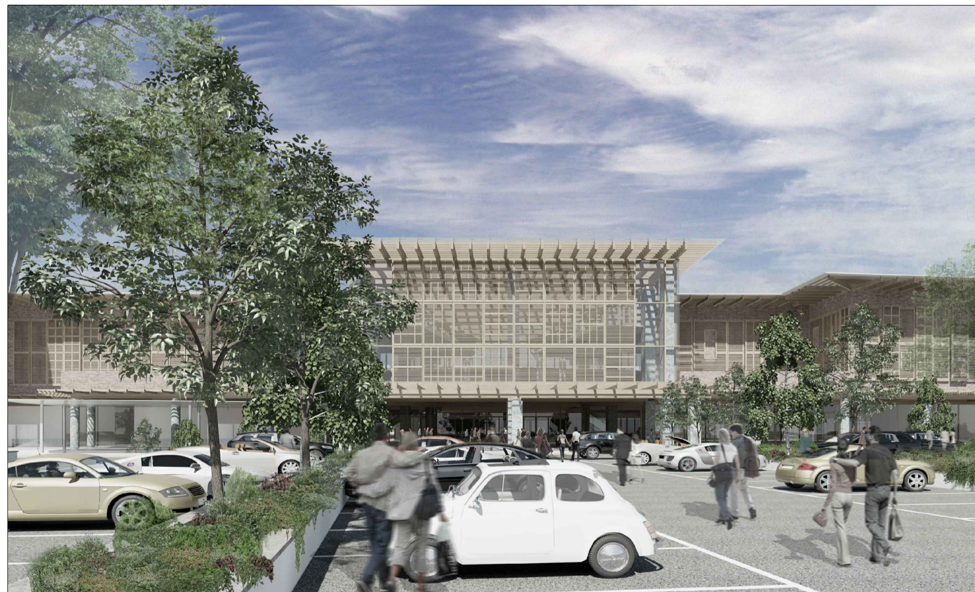
vista verso gli ingressi del centro polifunzionale