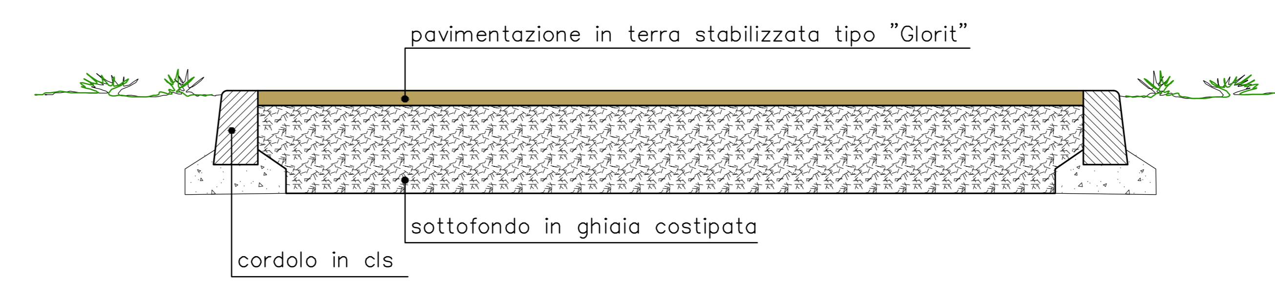
SEZIONE TIPO Pista ciclo-pedonale

COMUNE DI ARESE COMUNE DI LAINATE PROVINCIA DI MILANO