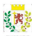
COMUNE DI VANZAGO