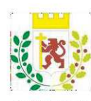
COMUNE DI VANZAGO