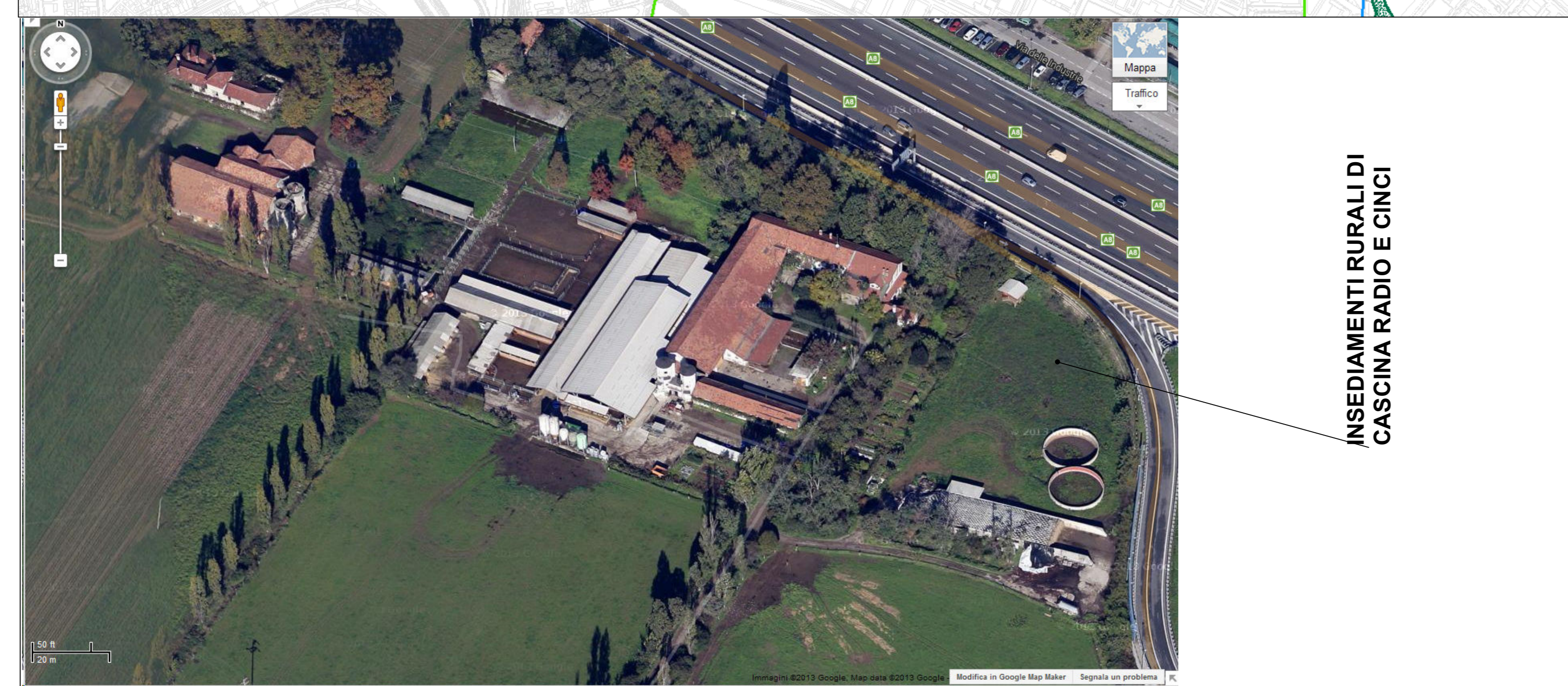
INSEDIAMENTI RURALI DI CASCINA RADIO E CINCI