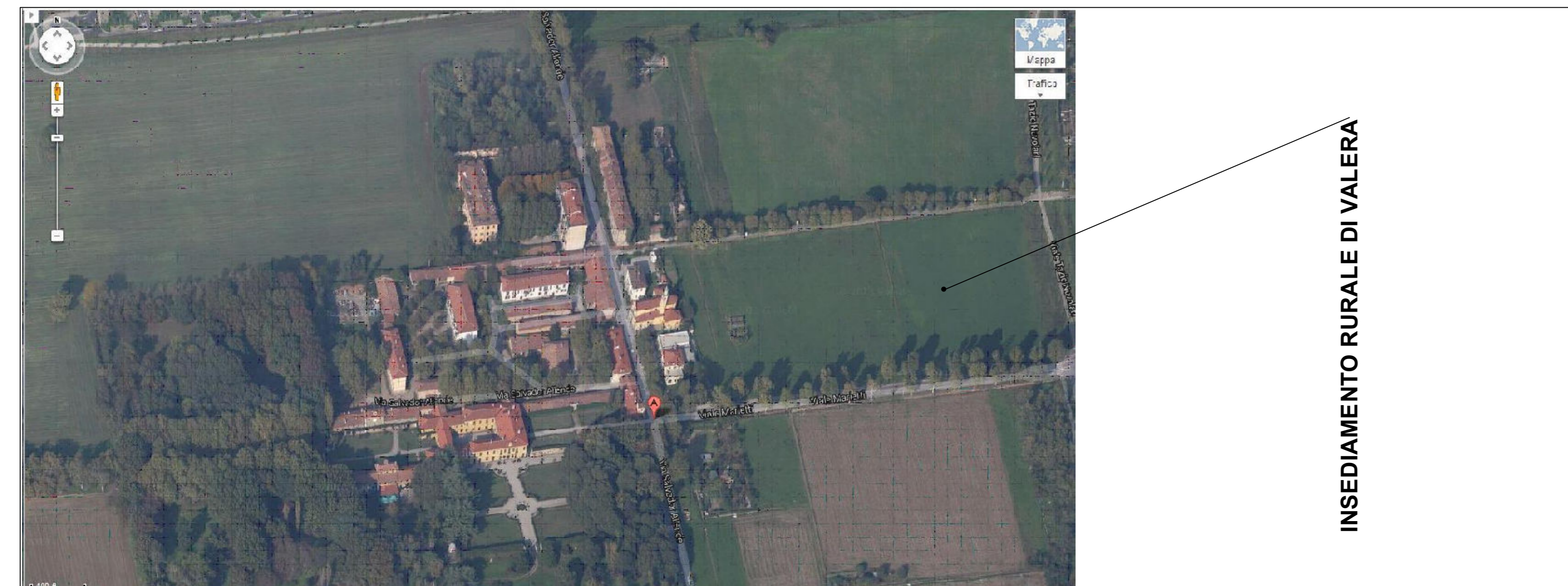
INSEDIAMENTO RURALE DI VALERA